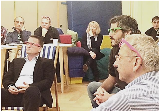
Mit Blick durch unterschiedliche Brillen an der Veranstaltung präsent: Vertreterinnen und Vertreter aller 3 Ebenen

Auf der Ebene Menschen wirken die Kita-oder Spielgruppenleiterin, die Mütterberaterin oder der Schulsozialarbeiter. Sie betreuen, begleiten, beraten Kinder oder deren Bezugspersonen.